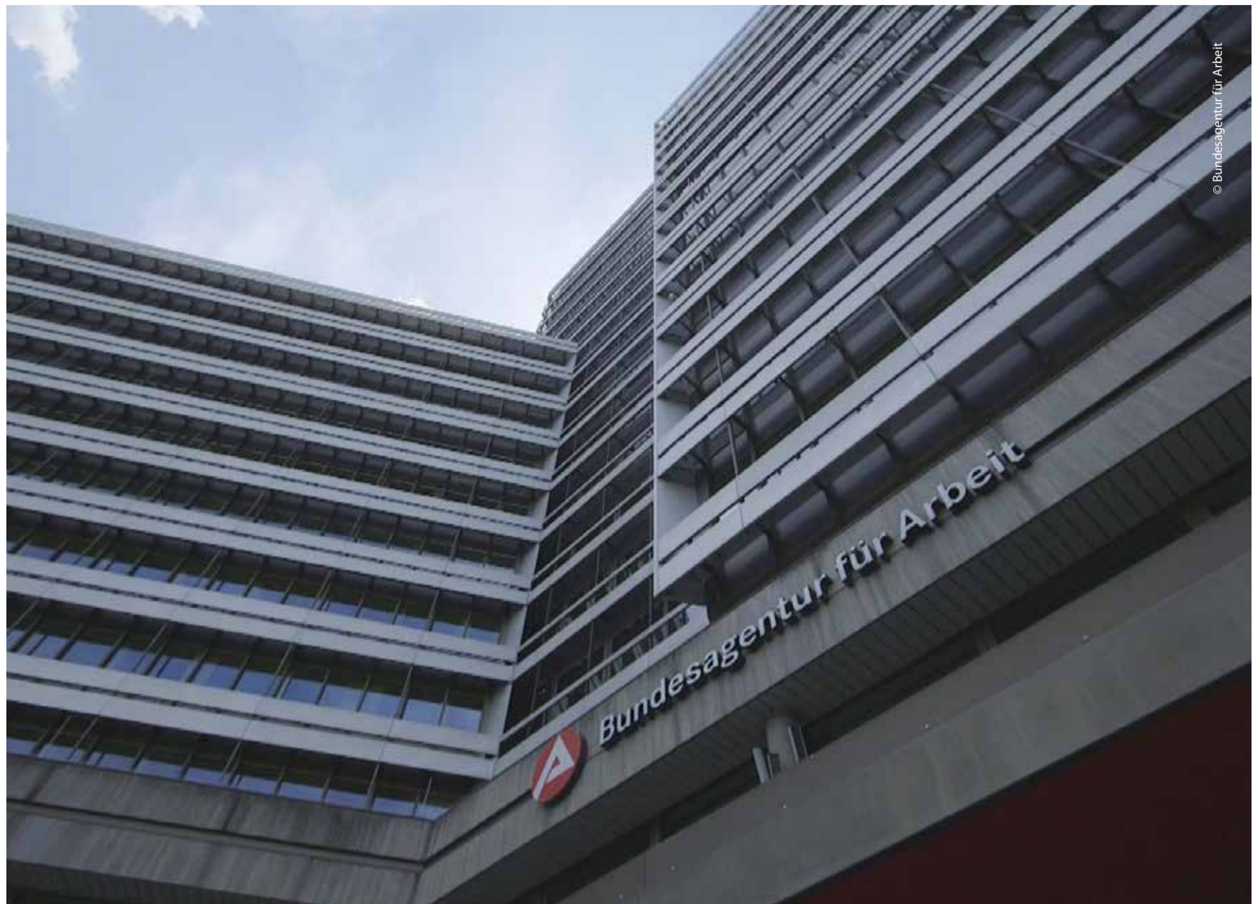
Fakten in Gebärdensprache: Die Arbeitsagentur bietet Pressekonferenzen mit Gebärdensprache an. Zudem gibt es Gebärdentelefonie oder Schrifttelefonie.

Auch 70 Jahre nach Gründung sorgt die BA heute für einen Ausgleich von Angebot und Nachfrage am Ausbildungs- und Arbeitsmarkt. Es vollzieht sich ein tiefgreifender Strukturwandel im Land: Mit der Digitalisierung und