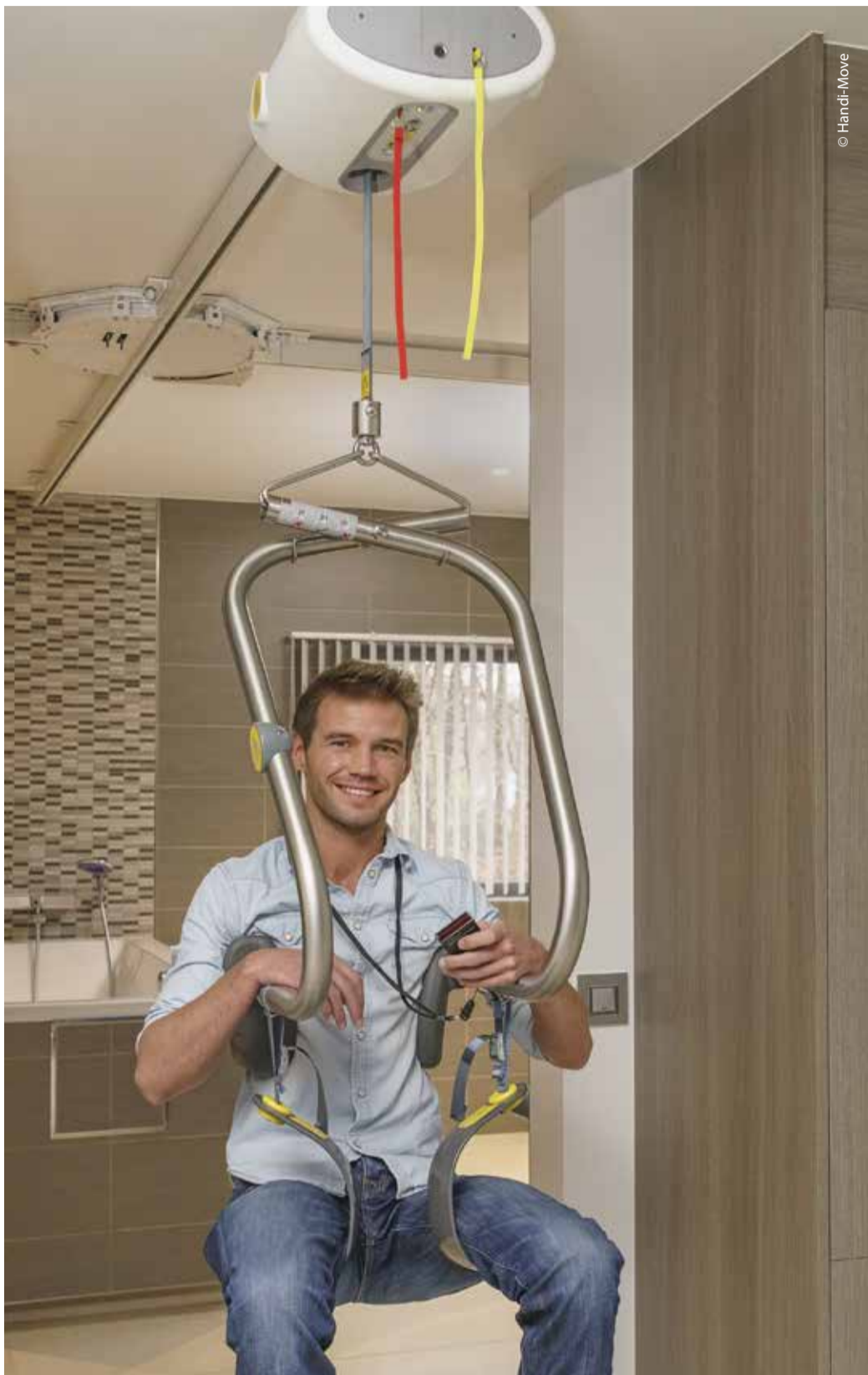
Der Deckenlifter mit original Hebebügel von Handy-Move.

Für mehr Mobilität unterwegs ist im Angebot auch ein Reise- bzw. Klapplifter. Ein Hebesystem kann noch so toll sein, es hilft einem jedoch nicht, wenn es nicht den eigenen Bedürfnissen entspricht. Um sich vorab gründlich zu informieren, kommen die Handy-Move Berater auch gerne zu einem Interessenten nach Hause. Ein Handy-Move Berater betrachtet sich selbst in erster Linie nicht als Verkäufer, sondern als Berater und Partner. Er begleitet den Nutzer vom ersten Beratungsgespräch bis zur Installation des Systems. Der Entwicklungsprozess wird von ihm von A bis Z überwacht und nach der Installation weist er den Nutzer in die optimale Handhabung des Systems ein. Der Service nach der Installation erfolgt durch die eigenen Mitarbeiter.