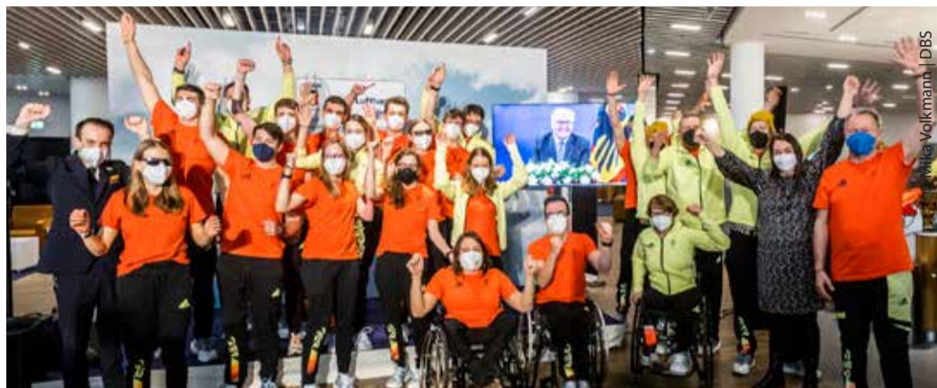
Das Team Deutschland der Paralympics.